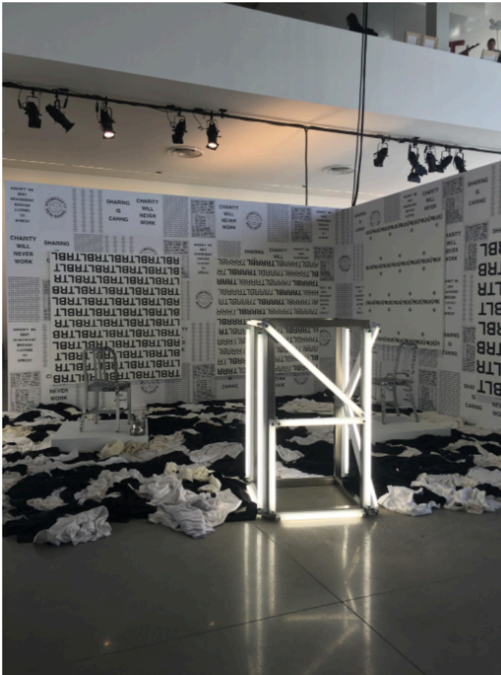
Independent 2016, New York