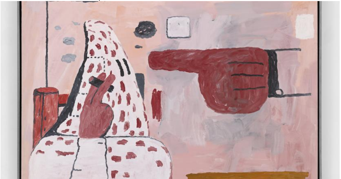
Philip Guston, Untitled, 1969, Lithographic crayon and oil on panel, Venduto da Hauser & Wirth

La fiera di punta del mercato mondiale è certamente partita con il piede giusto, ribaltando l'andamento in decrescita degli ultimi due anni e facendosi specchio di un mercato sano e forte, come riportano i primi dati: nel primo giorno il valore delle vendite pare abbia superato i 60 milioni di dollari (un olio su tela di Philip Guston, artista americano attualmente alle Gallerie dell'Accademia di Venezia, venduto per 15 milioni di dollari da Hauser & Wirth).